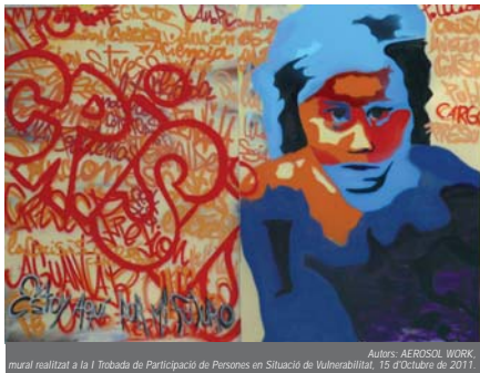
Autors: AEROSOL WORK, mural realitzat a la I Trobada de Participació de Persones en Situació de Vulnerabilitat, 15 d'octubre de 2011.

O, en lloc de reduir els serveis d'ajuda a les persones amb dependència (intentant estalviar 600 milions d'euros), podrien haver reduït el subsidi de l'Estat a l'Església catòlica per impartir docència de la religió catòlica a les escoles públiques, o eliminar la producció de nou equipament militar, com els helicopters Tigre i altres armaments.